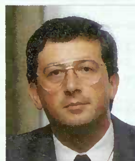
M. Jean-Claude Juncker

Ministre de l'Intérieur, Ministre du Logement