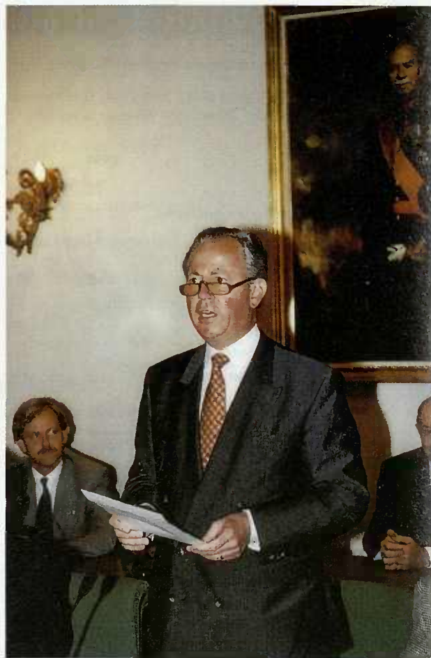
Au nom du Grand-Duc, Monsieur Jacques Santer, Premier Ministre, Ministre d'Etat ouvre la session extraordinaire de la Chambre des Députés.

La Chambre s'est réunie de nouveau le 22 juillet, pour entendre la Déclaration gouvernementale faite par Monsieur Jacques Santer, Premier Ministre, Ministre d'Etat. Le débat sur la déclaration gouvernementale a eu lieu à la Chambre des Députés les 26 et 27 juillet. C'est dans la soirée du 27 juillet, après de très nombreuses interventions des députés, que la motion suivante a été adoptée par 38 voix contre 22: «La Chambre des Députés, après avoir entendu la déclaration gouvernementale, y donne son approbation, fait confiance au Gouvernement pour sa réalisation et passe à l'ordre du jour».