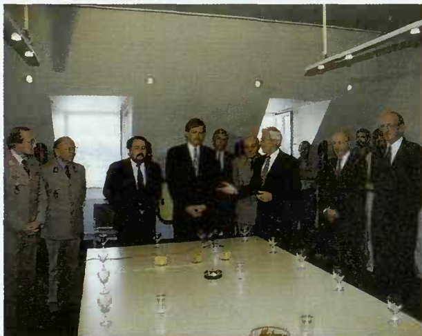
La passation des pouvoirs au Ministère de la Force publique...