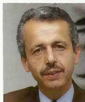
M. Marc Fischbach

Ministre des Finances, Ministre du Travail