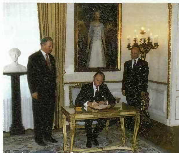
S.A.R. le Grand-Duc signe les arrêtés grands-ducaux concernant le nouveau Gouvernement.

Au cours de la matinée du même jour, le Grand-Duc a signé l'arrêté grand-ducal portant organisation du Gouvernement, l'arrêté grand-ducal portant constitution des départements ministériels, l'arrêté grand-ducal portant attribution des départements ministériels aux Membres du Gouvernement et l'arrêté grand-ducal portant nomination de Madame Mady Delvaux-Stehres à la fonction de Ministre. Auparavant, le Grand-Duc avait reçu en audience les membres du gouvernement.