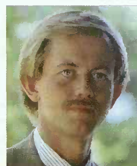
M. Alex Bodry

Ministre de l'Economie, Ministre des Travaux Publics, Ministre de l'Energie