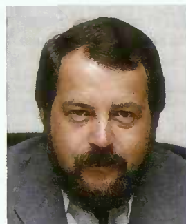
M. Georges Wohlfart

Ministre de la Sécurité Sociale, Ministre des Transports, Ministre des Communications