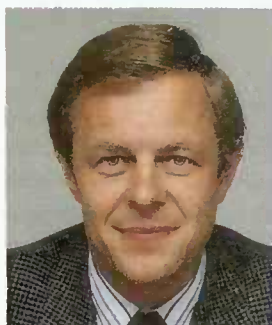
M. Fernand Boden

Vice-Premier Ministre, Ministre des Affaires Etrangères, du Commerce Extérieur et de la Coopération