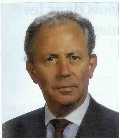
M. Jacques Santer

Premier Ministre, Ministre d'Etat, Ministre du Trésor, Ministre des Affaires Culturelles