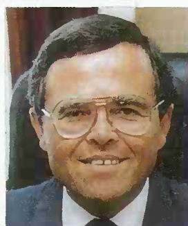
M. Johny Lahure

Ministre de l'Education Nationale et de la Recherche Scientifique, Ministre de la Justice