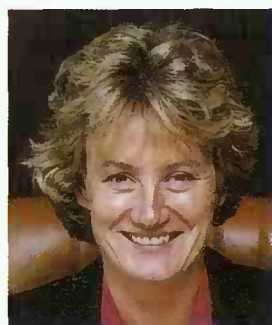
Mme Mady Delvaux-Stehres

Ministre de l'Agriculture, de la Viticulture et du Développement Rural, Ministre délégué aux Affaires Culturelles