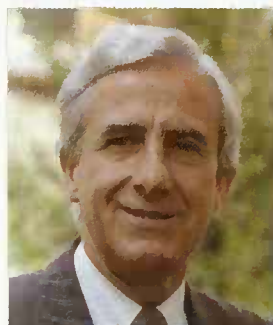
M. Jacques F. Poos

Premier Ministre, Ministre d'Etat, Ministre du Trésor, Ministre des Affaires Culturelles