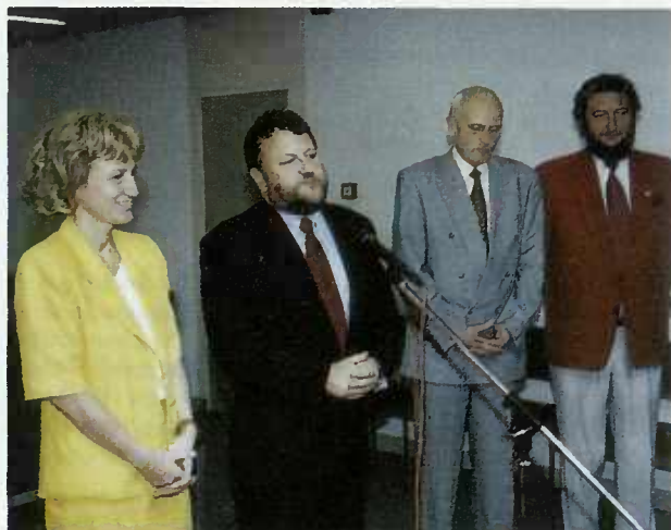
... et au Ministère des Transports