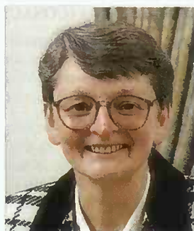
Mme Marie-Josée Jacobs

Ministre de l'Aménagement du Territoire, Ministre de la Force Publique, Ministre de l'Education Physique et des Sports, Ministre de la Jeunesse