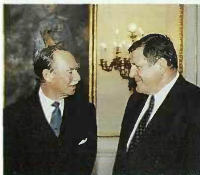
Le Grand-Duc et M. Meciar

visite à Luxembourg, au cours de laquelle il fut reçu en audience par Son Altesse Royale le Grand-Duc.