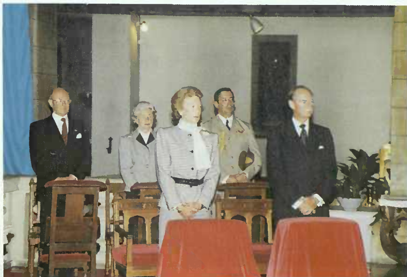
Le 15 septembre 1993, Leurs Altesses Royales le Grand-Duc et la Grande-Duchesse ont assisté, à la Cathédrale de Luxembourg, au Service religieux à la mémoire de S.M. le Roi des Belges.