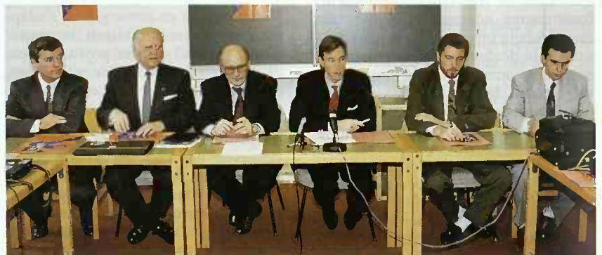
S.A.R. le Prince Guillaume présente le programme Mérite Jeunesse Benelux.

Beide Minister vereinbarten auch eine Intensivierung der Kooperation im Wissenschafts- und Forschungsbereich. Neue Möglichkeiten der Zusammenarbeit für das „Centre Universitaire“, das „Institut Supérieur de Technologie“ sowie die „Centres de recherche publics“ wurden erörtert. Die definitive Gestaltung dieser Projekte wird, nach Vorarbeiten auf Expertenniveau, in Luxemburg festgeschrieben anlässlich eines für in ein paar Monaten vereinbarten Besuchs von Minister von Trotha.