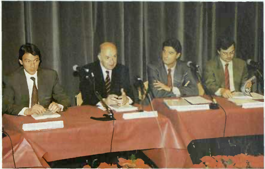
M. Jean Spautz, Ministre du Logement et de l'Urbanisme, présente l'étude sur l'habitat.

Allerdings wird aufgrund der Haushaltsentwicklung die vermehrte Bereitstellung von Kleinwohnungen für die stark wachsende Zahl der Single-Haushalte und von Großwohnungen, an denen es heute mangelt, erforderlich. Mittelgroße Wohnungen gibt es vorläufig genug.