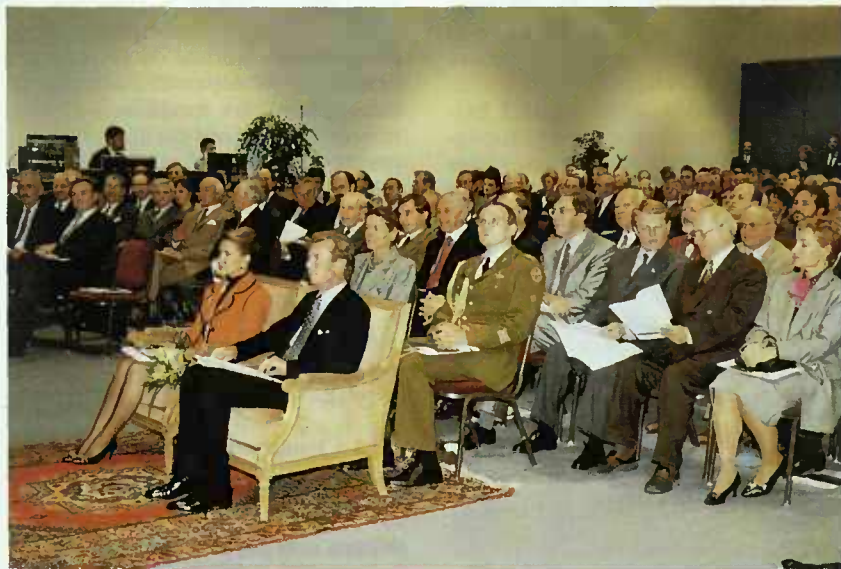
Lors de la séance académique d'ouverture de la Foire d'automne

Als Erfolge werteten die Minister auch das erste überregionale Fachkräftetreffen „Suchtprävention ohne Grenzen“, das im September in Saarbrücken stattfand. Gemeinsamkeiten in den Kriterien zur Suchtprophylaxe wurden