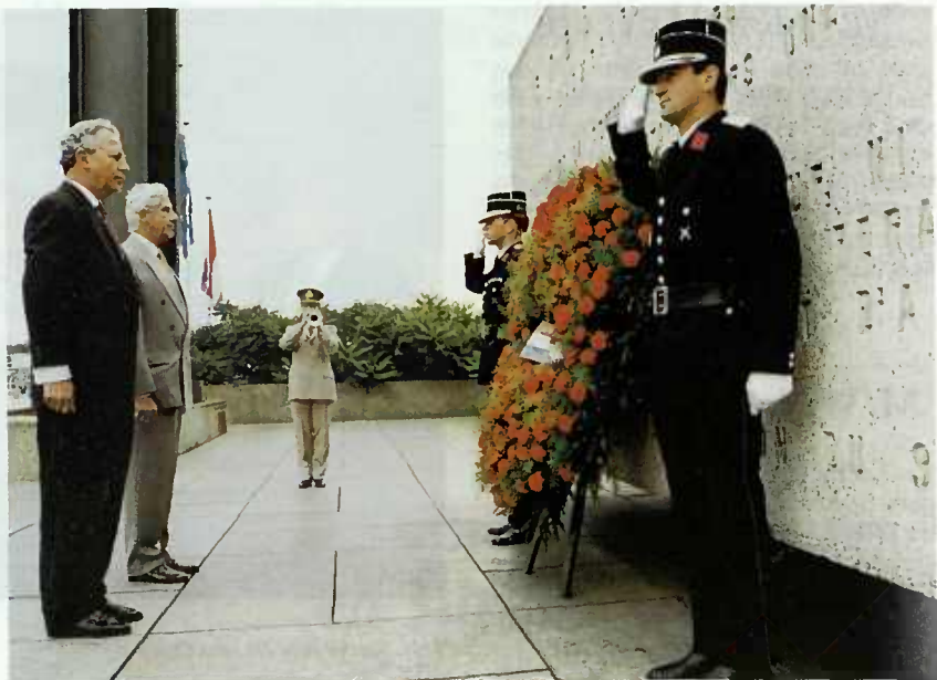
MM. Jacques Santer, Premier Ministre et Jacques F. Poos, Ministre des Affaires étrangères devant le Monument Robert Schuman

MM. Jacques Santer, Premier Ministre, et Jacques F. Poos, Ministre des Affaires Étrangères, ont déposé une couronne au Monument Robert Schuman, — mémorial qui rappelle la déclaration du 9 mai 1950 —.