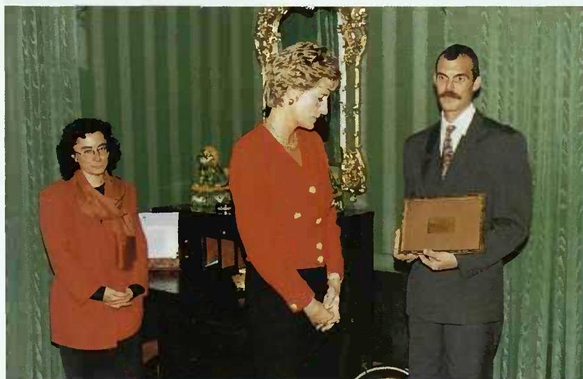
Lors de la présentation du cadeau du Gouvernement de Sa Majesté aux responsables du Centre de réhabilitation de Manternach