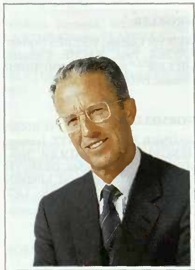
S.M. le Roi Baudouin

En signe de deuil, les couleurs luxembourgeoises furent mises en berne durant 48 heures, à partir des Funérailles d'État.