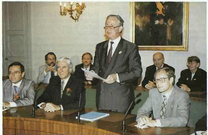
Au nom du Souverain, le Premier Ministre Jacques Santer ouvre la session ordinaire 1993/94 de la Chambre des Députés.