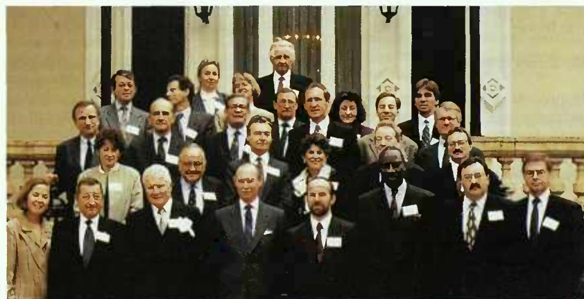
Le 20 octobre 1993, Son Altesse Royale le Grand-Duc a reçu en audience, à la Villa Vauban, les directeurs des départements « Droits de l'Homme » auprès des Ministères des Affaires étrangères de 26 pays occidentaux.

Les 26 pays participants sont, outre le Luxembourg: Allemagne, Australie, Autriche, Belgique, Canada, Danemark, Espagne, États-Unis d'Amérique, Finlande, France, Grèce, Hongrie, Irlande, Italie, Japon, Pays-Bas, Nouvelle-Zélande, Norvège, Pologne, Portugal, République Slovaque, République tchèque, Royaume-Uni, Suède et Suisse.