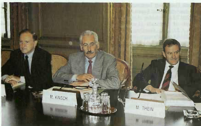
Lors de la conférence de presse de l'ARBED

Le climat économique ne s'est pas amélioré au cours du 3e trimestre de l'année. La perspective d'un léger