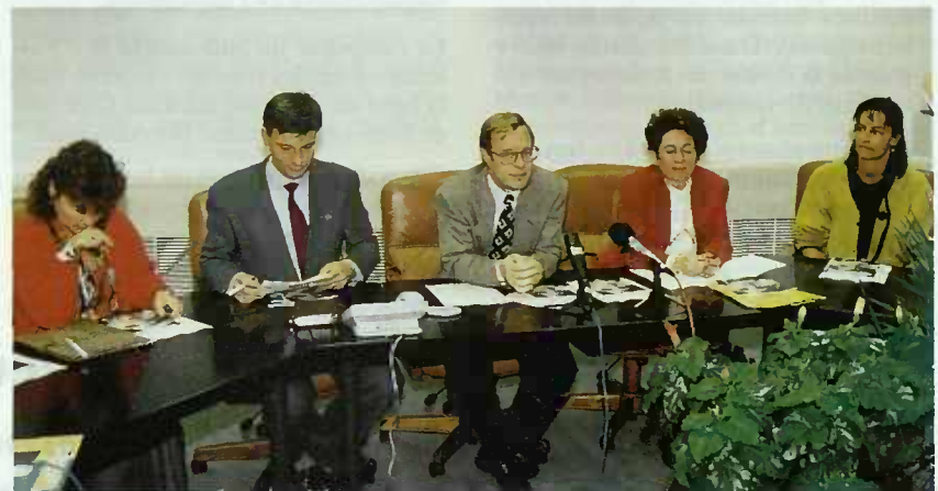
Le Ministre Fernand Boden et ses collaborateurs pendant la conférence de presse

Cette violence peut se présenter sous diverses formes et peut survenir dans de multiples situations et endroits. On distingue 4 formes de violence: la violence verbale, la violence psychologique, la violence physique et la violence sexuelle. Elle constitue une expérience traumatisante qui porte atteinte à la qualité de vie de la femme ainsi qu'à la dignité et à l'intégrité de celle-ci. Toutes ces formes de violence se trouvent de manière latente au sein de notre société. Les lieux d'expression