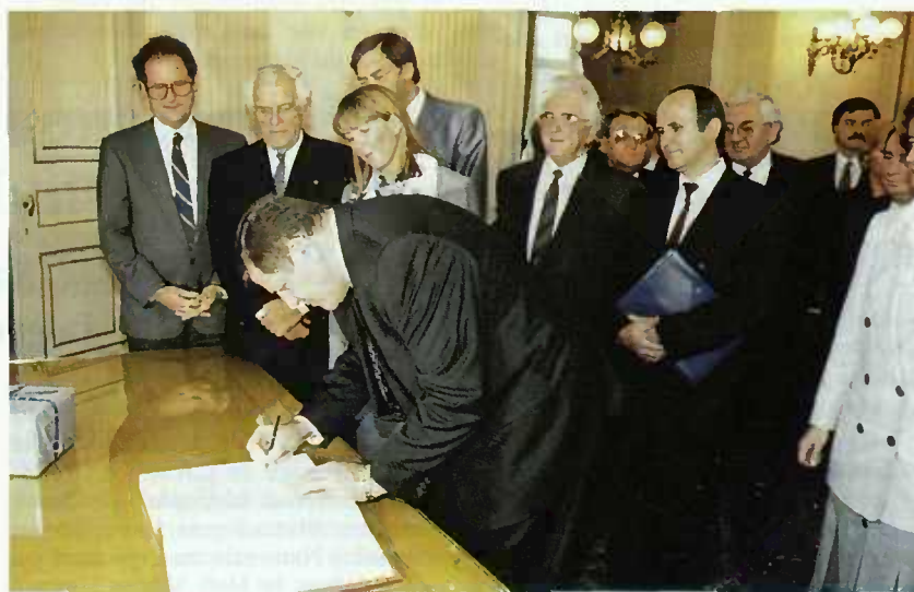
Le Premier Ministre de la République slovaque signe le livre d'or de la Ville de Luxembourg