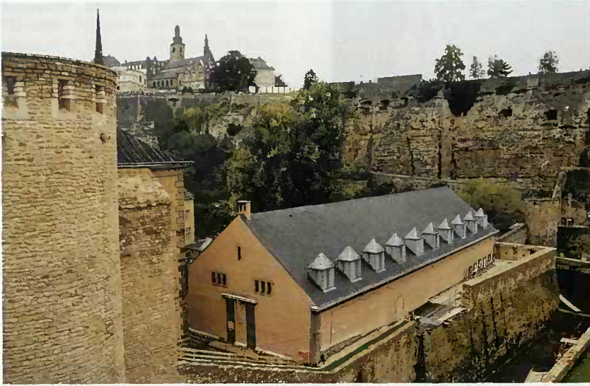
La partie restaurée du mur de Wenceslas

ce notamment en présence de Madame Marie-Josée Jacobs, Ministre délégué aux Affaires culturelles.