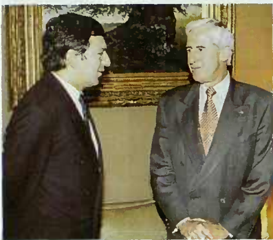
M. Poos et son homologue portugais

Le 13 septembre 1993, Monsieur Manuel Durao Barroso a effectué une visite à Luxembourg, au cours de laquelle il a eu successivement des entretiens avec Son Altesse Royale le Grand-Duc, Monsieur Jacques Santer, Premier Ministre, Ministre d'Etat, Monsieur Jacques F. Poos, Vice-Premier Ministre, Ministre des Affaires étrangères et Monsieur Marc Fischbach, Ministre de l'Education nationale.