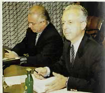
Lors de la conférence de presse du Ministre de l'Éducation nationale, M. Marc Fischbach

C'est alors que la rentabilité de l'investissement dans la formation professionnelle continue réalisé en partenariat avec l'INFPC sera visible pour