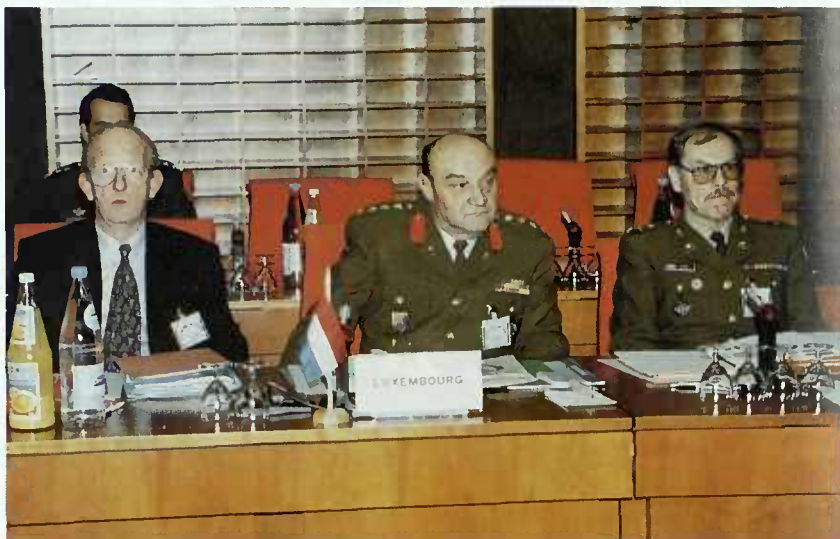
La délégation luxembourgeoise

Le 22 octobre 1993 a eu lieu au Centre de Conférences du Kirchberg la réunion UEO des Chefs d'État-Major des Armées des pays membres et associés de l'Union de l'Europe de l'Ouest.