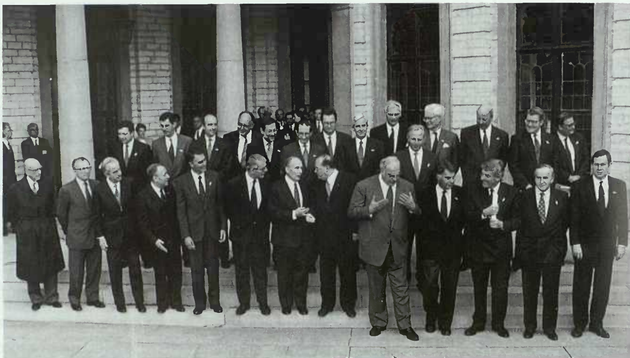
Au Conseil Européen extraordinaire du 29 octobre 1993 à Bruxelles, le Grand-Duché de Luxembourg était représenté par Monsieur Jacques Santer, Premier Ministre, Ministre d'Etat et Monsieur Jacques F. Poos, Vice-Premier Ministre, Ministre des Affaires étrangères.

des problèmes de société qui dépassent les frontières, comme la drogue, la criminalité organisée et l'immigration illégale. Enfin, plus de démocratie, sous toutes ses formes et à tous les niveaux, qu'il s'agisse du jeu institutionnel interne ou des rapports entre l'Union, les États membres et les citoyens.