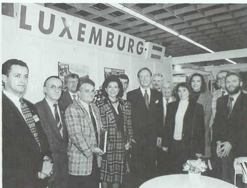
Le stand officiel luxembourgeois à l'ANUGA