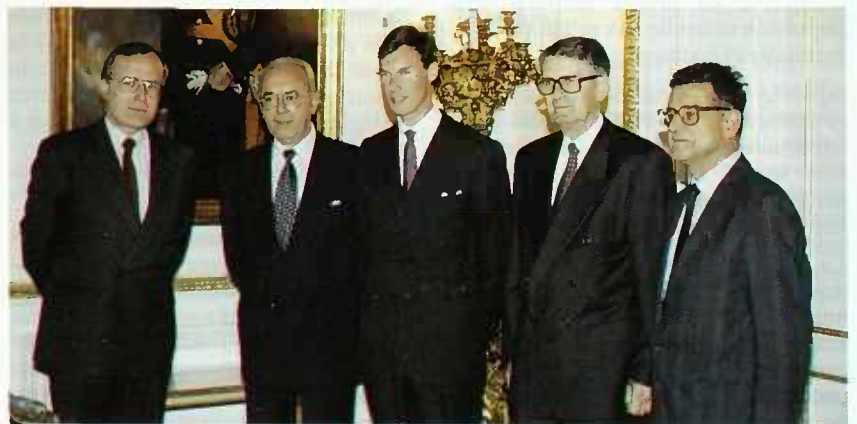
Lors de la réception à la Villa Vauban

bres du Bureau Exécutif de la Fédération Européenne d'Épargne et de Crédit pour le Logement.