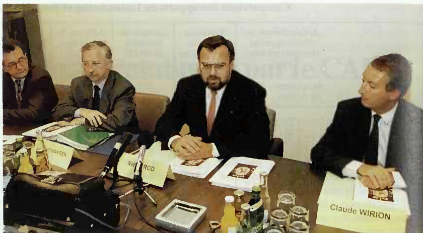
Le rapport annuel du Commissariat aux assurances fut présenté à la presse le 6 octobre 1993.

vert » leur clientèle traditionnelle luxembourgeoise et ont développé des actions commerciales et des améliorations de leurs services en vue d'une fidélisation accrue de ces clients traditionnels ;