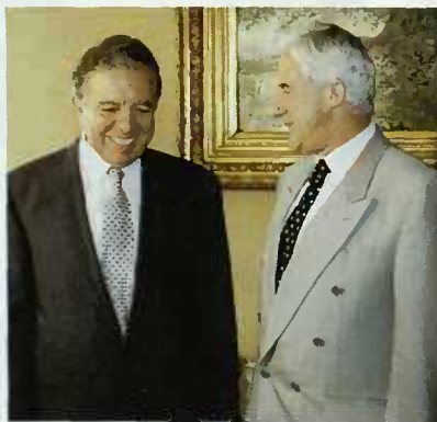
MM. Poos et Michaelides

Jacques Santer, Premier Ministre, Ministre d'Etat et Monsieur Jacques F. Poos, Vice-premier Ministre, Ministre des Affaires étrangères.