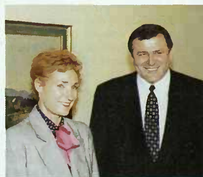
Mme Hennicot-Schoepges et M. Meciar