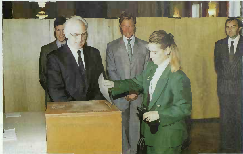
Leurs Altesses Royales le Grand-Duc Héritier et la Grande-Duchesse Héritière et le Prince Guillaume ont voté au Cercle municipal.