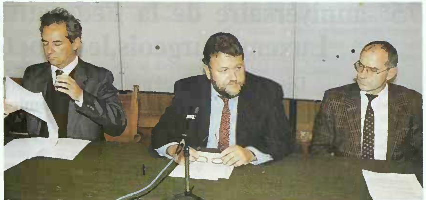
Le Ministre Robert Goebbels donne des explications à la presse.

Deux nouvelles routes de départ ont été créées, l'une en direction de Paris,