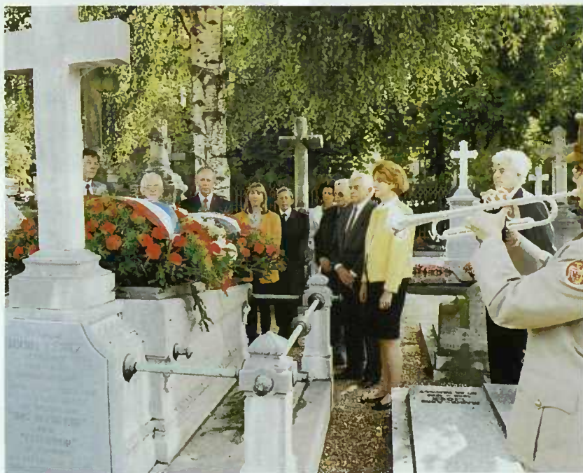
Um Graf vum Michel Lentz

Am 8./9.9.93 fand in Saarbrücken bzw. Perl-Nennig (Schloß Berg) das erste Treffen der Interregionalen Pressekonferenz – Presse Interrégionale (IPK) statt, das von der Landespressekonferenz Saar vorbereitet wurde. Zu den Gesprächspartnern zählten auch Premierminister Santer und Umweltminister Bodry.