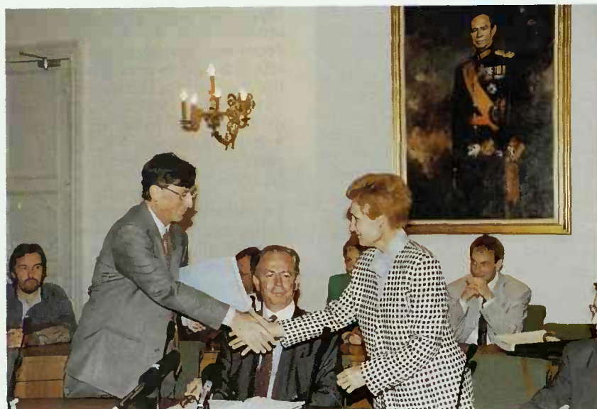
M. Jean-Claude Juncker, Ministre des Finances, remet le projet de budget à Mme Erna Hennicot-Schoepges, Présidente de la Chambre des Députés.

Quant à l'emploi intérieur, il a encore progressé de 1,8% en 1992 pour dépasser le seuil des 200.000 personnes. Cette tendance ascendante semble se poursuivre en 1993. À la fin du premier trimestre de l'année en cours, l'emploi total s'est chiffré à 203.000 unités, soit 2.000 personnes ou 1,0% de plus que fin décembre. L'emploi frontalier continue sa croissance pour atteindre en 1993 un niveau de 46.100 unités, soit 4.300 personnes ou 10,3% de plus que pour la même période l'année précédente.