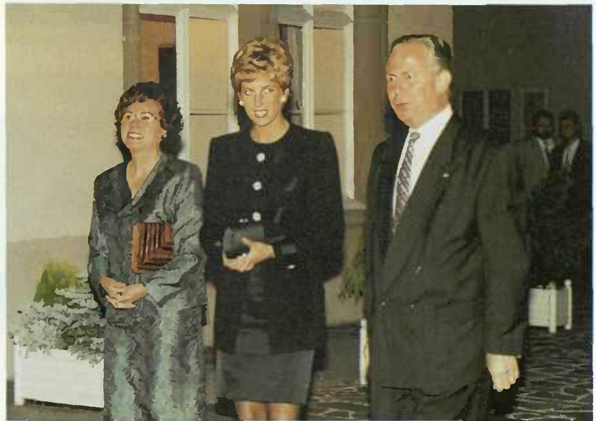
Devant le Château de Senningen