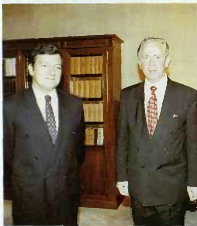
MM. Santer et Barroso