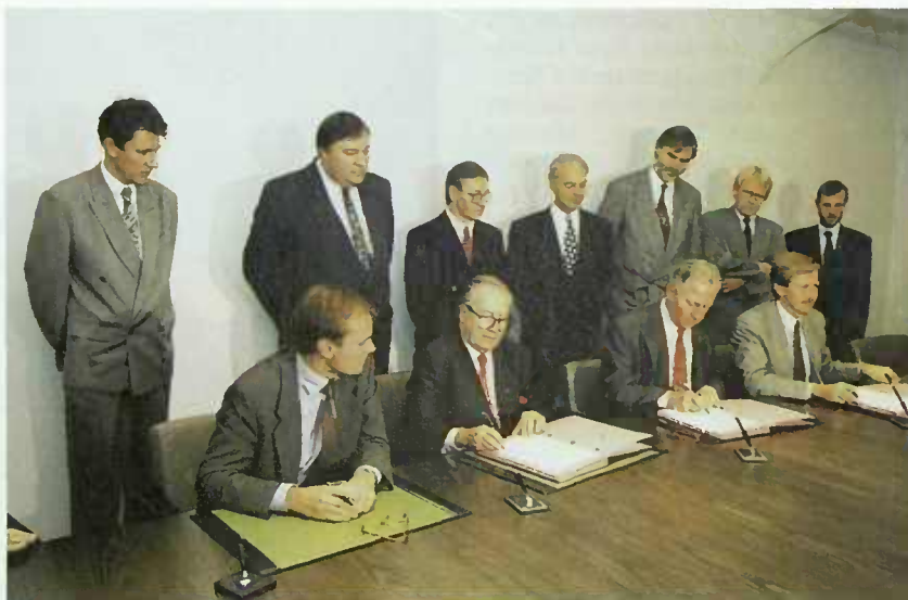
La cérémonie de signature Gouvernement-CLT

Une convention au sujet d'une extension substantielle de l'entreprise Sommer Industrie implantée dans la zone industrielle d'Eselborn/Clervaux fut signée le 4 octobre 1993 au siège de l'entreprise à Eselborn.