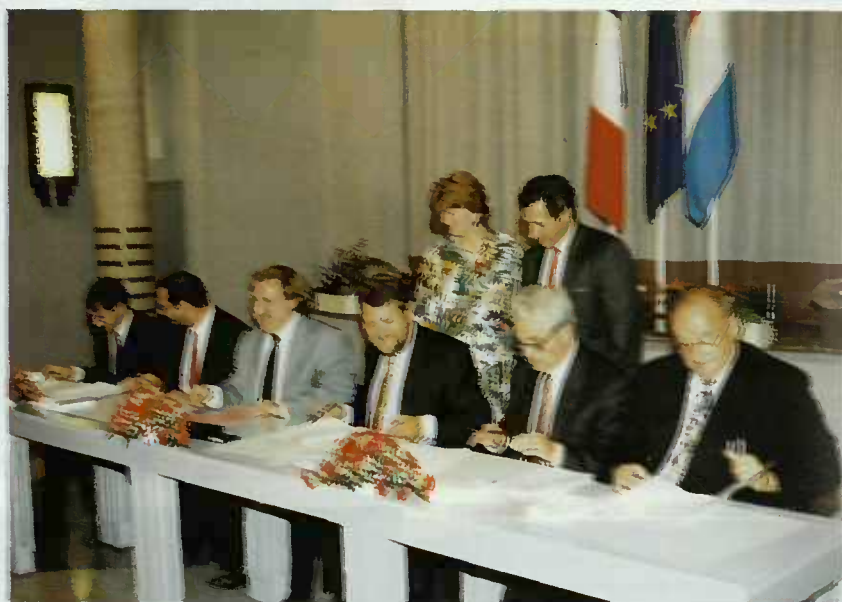
FLEX WAY: Lors de la cérémonie de signature au Château Collart à Bettembourg

Il y a à peine un an j'ai signé avec mon homologue français de l'époque, M. Bianco, l'accord sur la connexion du Grand-Duché au TGV-Est. Quinze jours plus tard nous avons réouvert la ligne de chemin de fer entre Audun-le-Tiche en territoire lorrain et Esch-Alzette en territoire luxembourgeois.