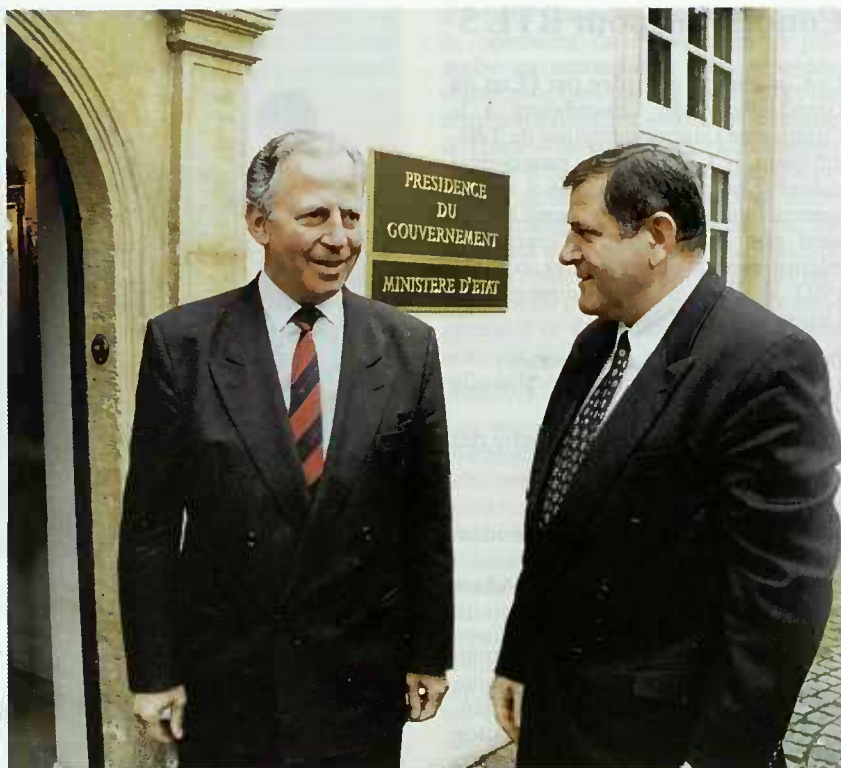
Le Premier Ministre Jacques Santer reçoit son homologue slovaque à la Présidence du Gouvernement.

Notant également avec satisfaction que 71 communes ont pris des mesures concrètes pour réviser leur stratégie locale en matière de logement, que 67 communes accordent une prime de construction et 55 communes une prime d'acquisition ;