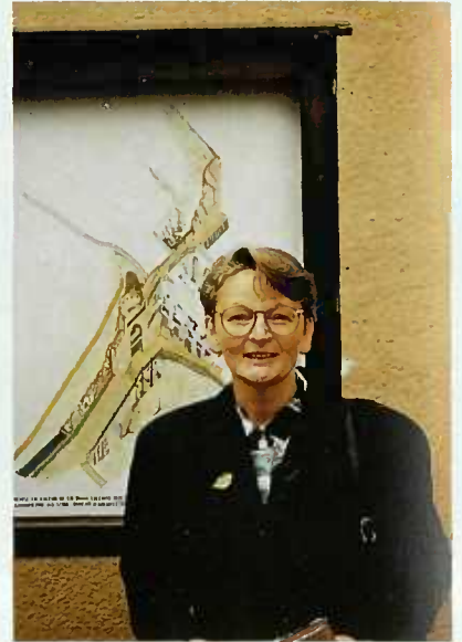
Le Ministre délégué aux Affaires culturelles, Mme Marie-Josée Jacobs donne des explications.