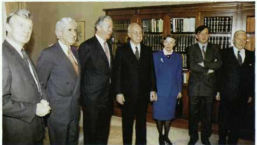
Le Premier Ministre Jacques Santer pendant sa laudatio

Y furent abordés les problèmes tels que l'intervention des pouvoirs publics et les droits des parents ou encore celui de la protection des familles et des enfants en période de crise.