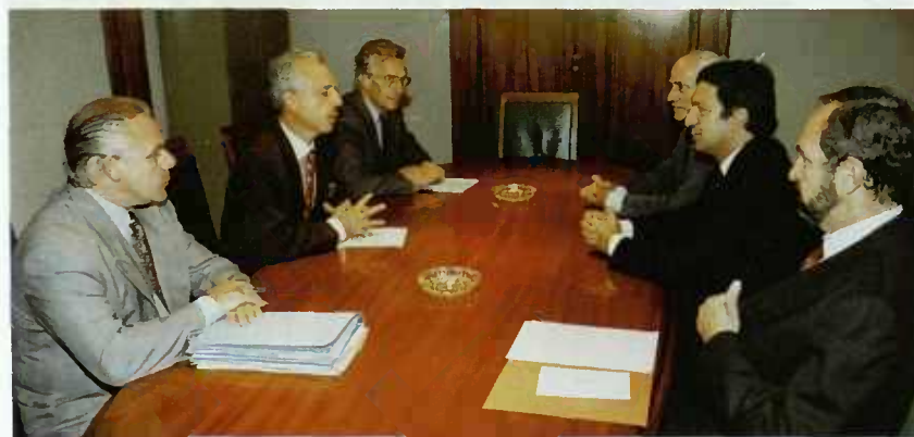
Entrevue Fischbach-Barroso au Ministère de l'Education nationale