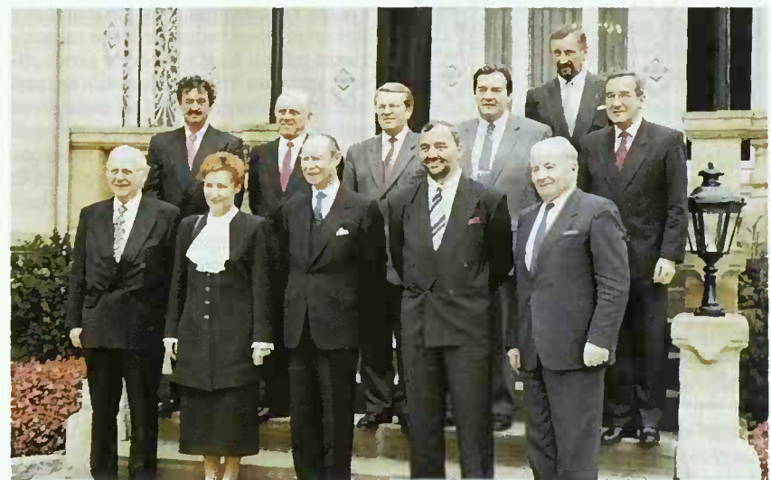
Le 25 octobre 1993, Son Altesse Royale le Grand-Duc a reçu en audience, à la Villa Vauban, le Bureau de la Chambre des Députés.