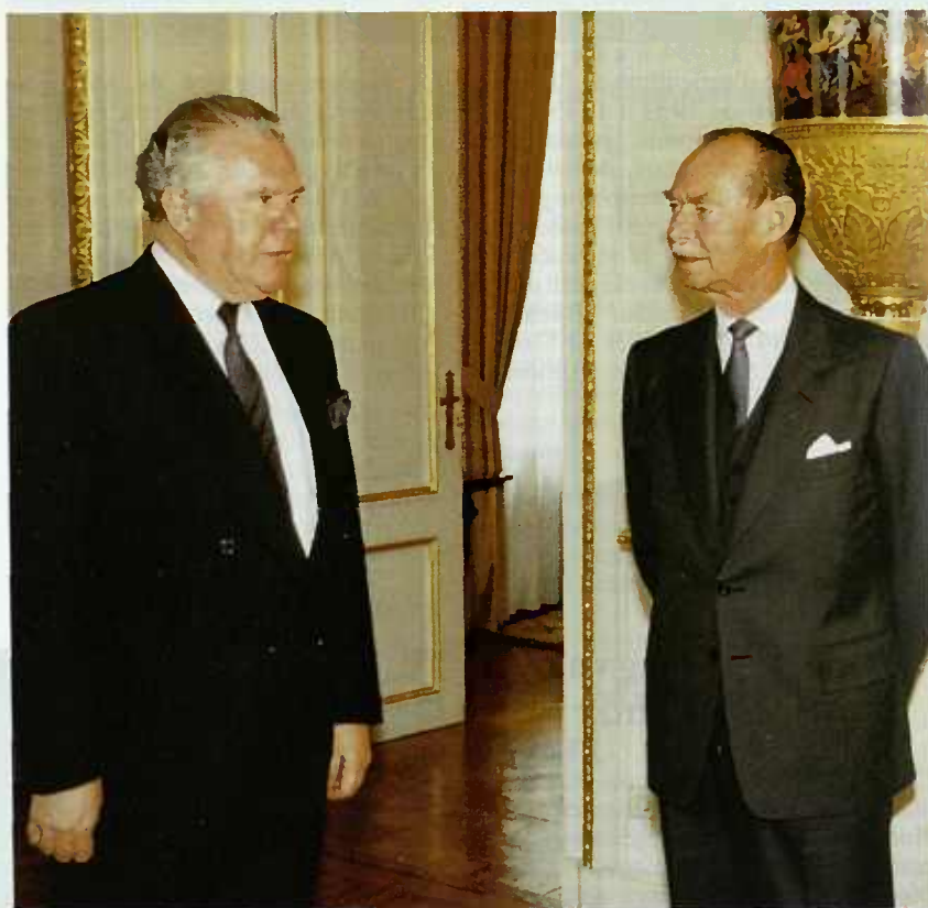
S.A.R. le Grand-Duc et Sir Dudley Smith

Le 8 septembre 1993, Sir Dudley Smith, Président de l'Assemblée de l'U.E.O. a séjourné à Luxembourg, où il fut reçu en audience par Son Altesse Royale le Grand-Duc.