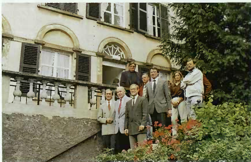
Les responsables devant le foyer d'accueil à Eisenborn

L'ensemble se compose d'une ancienne maison de maître construite au 19e siècle par des réfugiés français fuyant la révolution de 1789, de bâtiments de ferme avec étables, granges et hangars, d'une maison d'habitation du