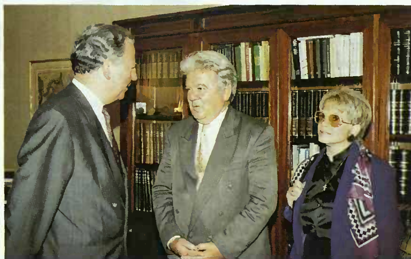
Le Premier Ministre Jacques Santer et le Président Oliviu Gherman