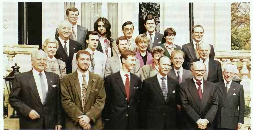
Son Altesse Royale le Grand-Duc a reçu en audience, à la Villa Vauban, les membres du Conseil d'Administration du Benelux Award.