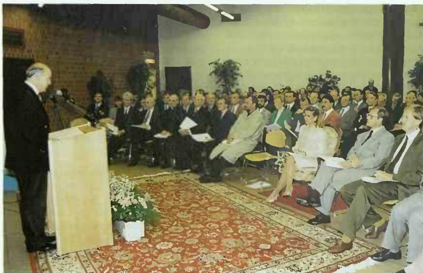
L'ouverture officielle de la « Semaine Nationale du Logement » a eu lieu en présence notamment de S.A.R. la Grande-Duchesse Héritière.

Le 5 octobre 1993 la Ville de Luxembourg a inauguré le nouvel immeuble abritant la Cinémathèque, la Photothèque et la Reliure municipales, sis, 10, rue Eugène Ruppert.