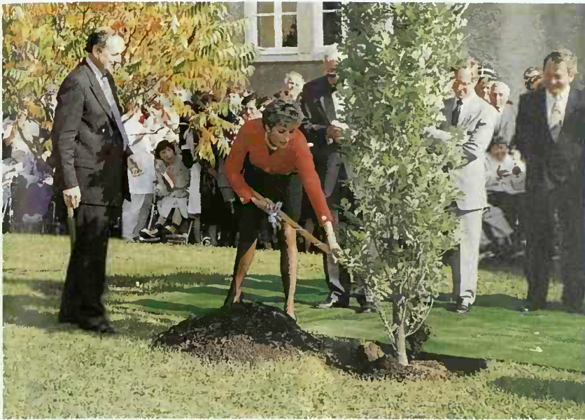
La Princesse de Galles plante un arbre dans l'enceinte de l'Institut