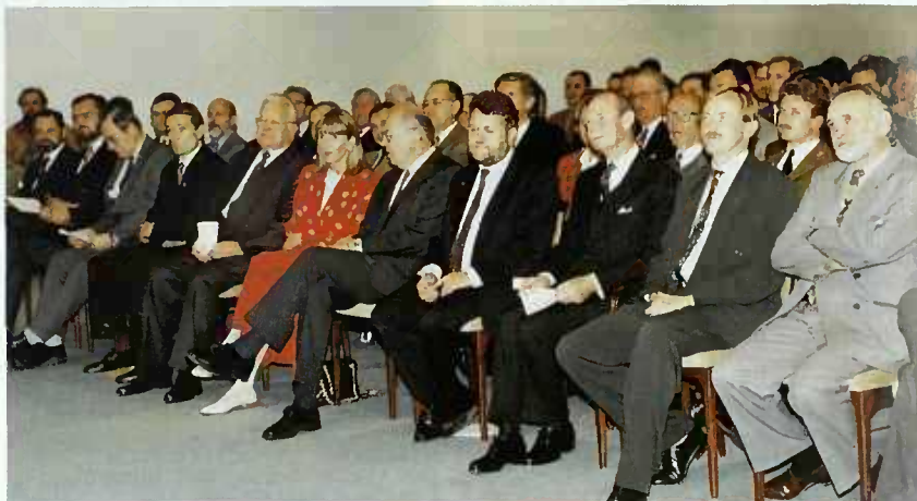
Son Altesse Royale le Grand-Duc a assisté à la séance académique organisée à l'occasion du 150 e Anniversaire de la création de l'Administration publique des Ponts et Chaussées et Bâtiments publics.

Mais ce sont finalement ces constructions hors de toute proportion commune qui constituent le « surhumain que reconnaissent les humains ». (André Malraux)