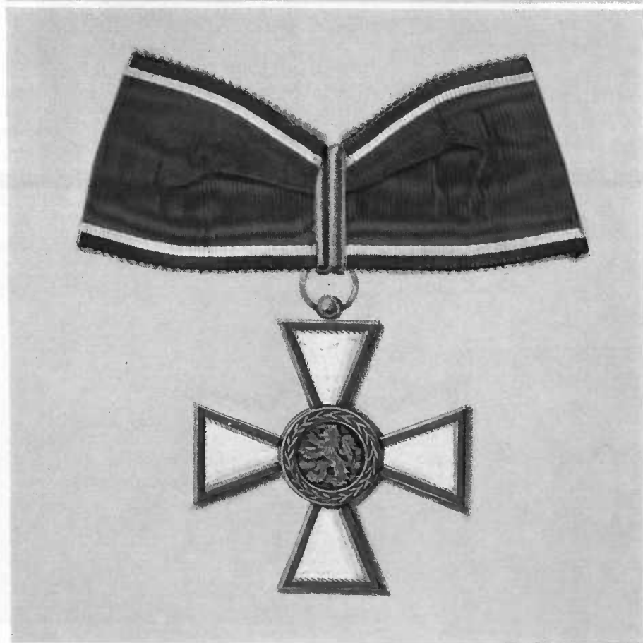
Insigne de Grand-Officier