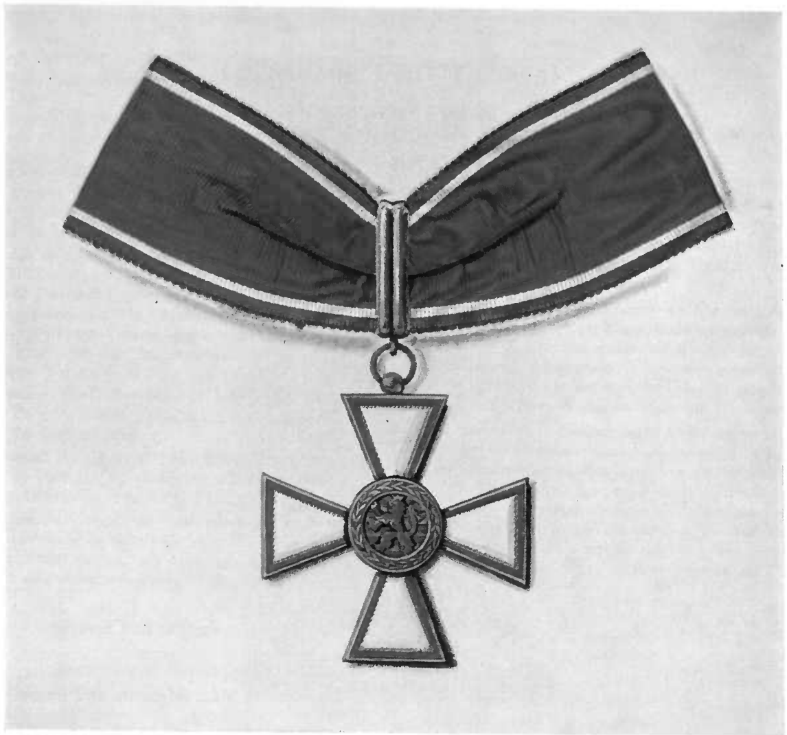
Insigne de Commandeur