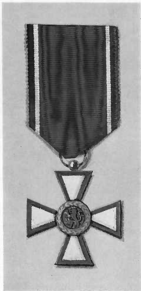
Insigne de Chevalier