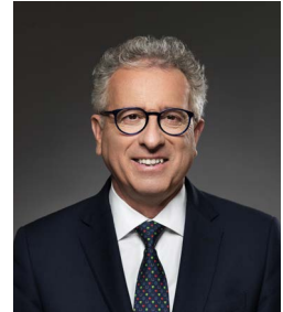
Finanzministère 3, rue de la Congrégation L-1352 Luxembourg Tel.: (+352) 247-82600 Fax: (+352) 47 52 41 Site: mfin.gouvernement.lu

Während der Lëtzebuenger EU-Présidence (zweet Halschent 2015) huet de Pierre Gramegna als President vun EU-Ministerrot fir Wirtschaft a Finanzen aktiv dozou