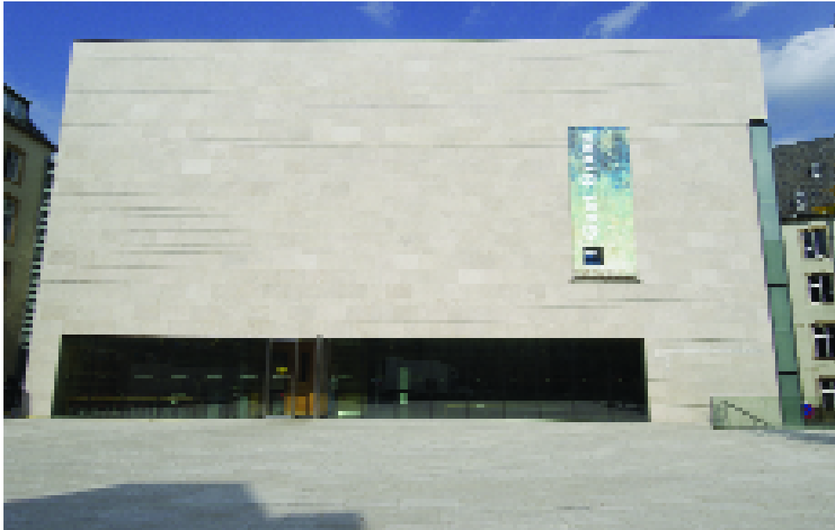
Le nouveau bâtiment du Musée national d'histoire et d'art marque le cœur de l'ancien quartier du Marché-aux-Poissons en pleine restructuration. L'idée était de refaire de ce lieu un nouvel espace public dans la ville