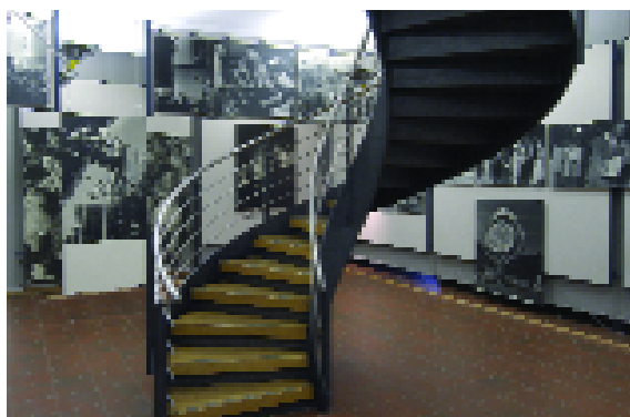
L'exposition Family of Man , installée au château de Clervaux, a été restaurée par le CNA

Installé à Dudelange, le Centre national de l'audiovisuel a pour mission de conserver, de restaurer et de mettre en valeur le patrimoine audiovisuel luxembourgeois. Le CNA applique également le dépôt légal pour les œuvres audiovisuelles. Il fait la promotion des artistes-photographes professionnels et sensibilise le public par le biais de stages. Enfin, il produit des œuvres, reportages, portfolios ou publications qui ont une valeur documentaire et culturelle.