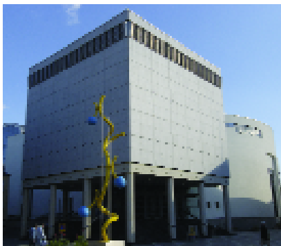
Dans le cadre de sa politique culturelle décentralisée, le gouvernement apporte une aide importante aux centres culturels régionaux tel qu'au Centre des arts pluriels Edouard Juncker à Ettelbruck

Berlaimont et Porte d'Eich, Porte des Bons-Malades, Fort Niedergrünewald, hauteurs du Pfaffenthal, Fort Obergrünewald, ouvrages militaires adjacents au Fort Thüngen.