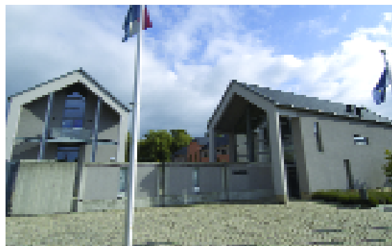
Kulturhuef à Grevenmacher, dans l'Est du pays

Le gouvernement est également décidé à examiner de nouveaux modes d'intervention du Fonds culturel national afin de promouvoir le mécénat et de créer de nouveaux mécanismes financiers pour aider les industries de la culture. Si les projets exceptionnels trouvent un financement conséquent, les projets quotidiens sont donc loin d'être les grands oubliés dans les réflexions gouvernementales.