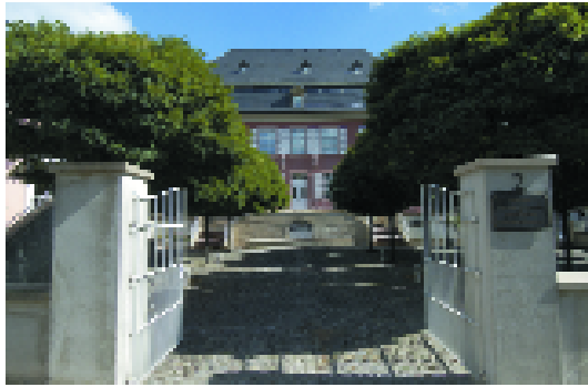
Le Centre national de la littérature, qui a ouvert ses portes en 1995 à Mersch, est en premier lieu un institut scientifique et un centre de recherche documentaire pour la littérature luxembourgeoise, qui met à la disposition des chercheurs une bibliothèque et des archives

s'inscrit dans la logique même du développement européen du Grand-Duché et de sa capitale. Le MUDAM devrait ouvrir fin 2005.