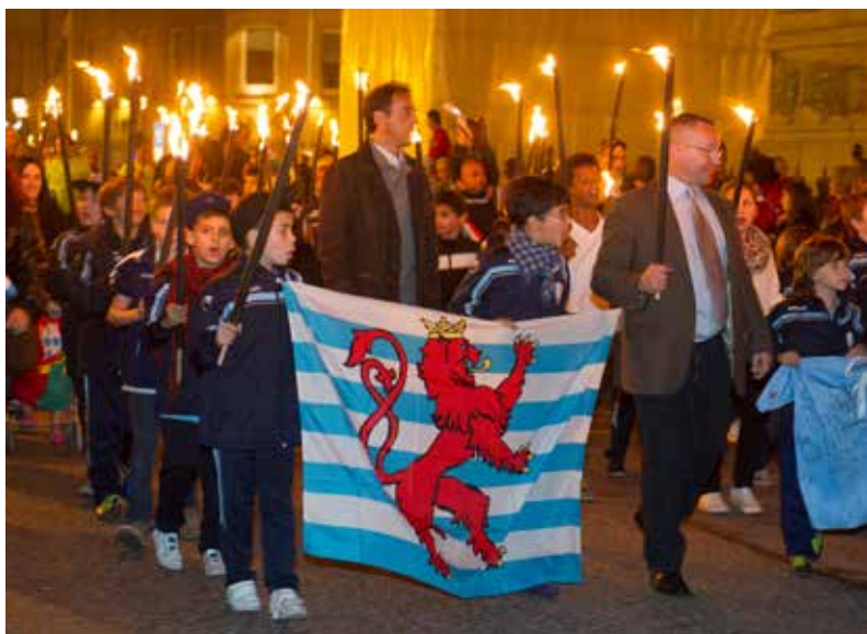
Fackelumzug am Vorabend des Nationalfeiertages

Die eigentlichen Feierlichkeiten beginnen am Vorabend des 23. Juni mit einem Fackelzug und einem anschließenden großen Feuerwerk mit musikalischer Begleitung in der Hauptstadt und anderswo im Land. Auch Besuche von verschiedenen Mitgliedern der großherzoglichen Familie finden bei dieser Gelegenheit in anderen Orten des Landes statt. Am Nationalfeiertag selbst werden Umzüge, Gottesdienste, Konzerte und Empfänge abgehalten. In der Hauptstadt finden zudem eine Militärparade und ein feierliches Tedeum in der Muttergottes-Kathedrale statt. Salutschüsse beenden den Tag zu Ehren des Luxemburger Monarchen und seines Volkes.