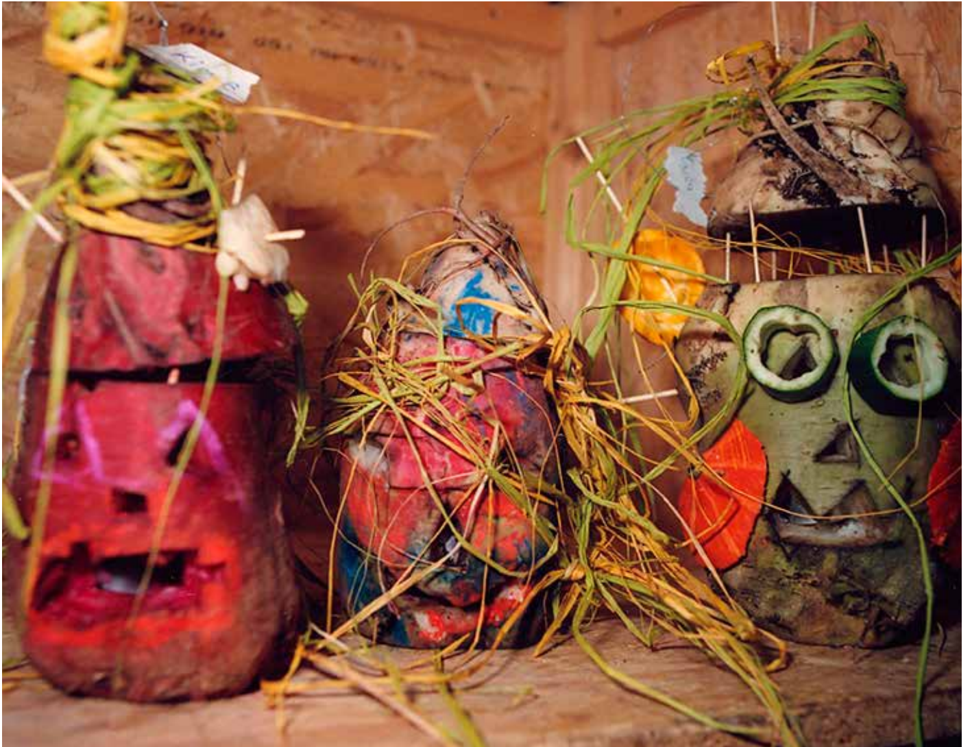
Das luxemburgische Halloween: d'Traulich brennen