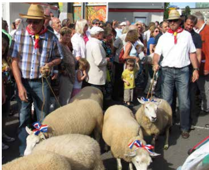
Eröffnung der Schueberfouer mit dem Hämmelesmarsch

konnte bislang nicht eindeutig geklärt werden. Entweder, heißt es, stammt er von ihrem ersten Standort, dem Schuedbiërg , ab. Oder aber vom Schober, dem einst neben jedem Bauernhaus vorhandenen Lagerraum für Tierfutter, denn schließlich fand die ursprüngliche Messe um den Bartholomäustag herum statt, also zur Erntezeit.