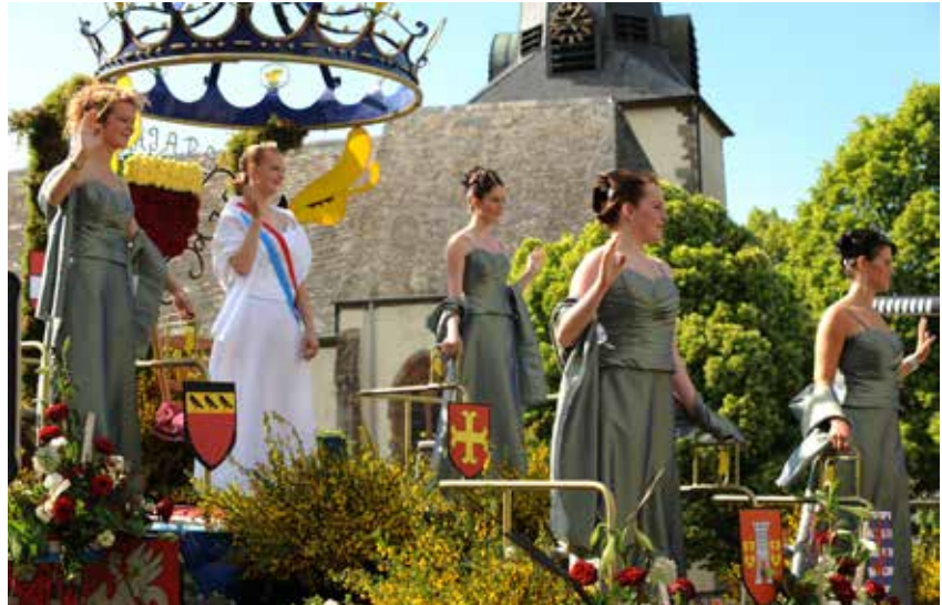
Geenzefest in Wiltz