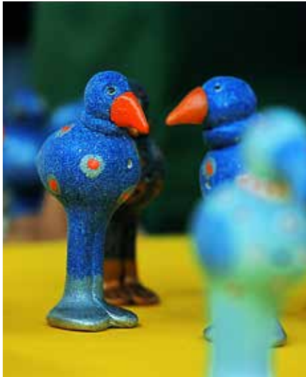
Péckvillercher auf der Éimaischen