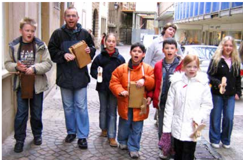
Die Kinder gehen klibbergen