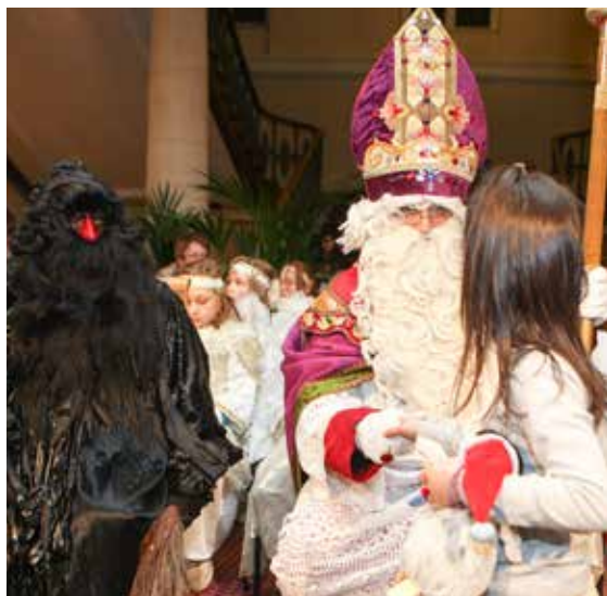
Kleeschen und Housecker