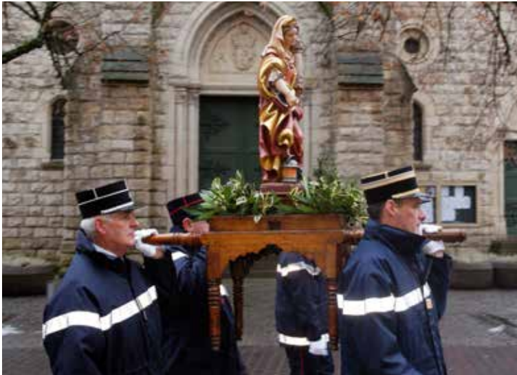
Bärbelendag im Süden des Landes

Einen ganz besonderen Bezug zum heiligen Hubertus hat die Öslinger Ortschaft Munshausen, deren Wappen seit 1983 der Hirsch mit dem Kreuz im Geweih schmückt. Zudem wird in der Ortschaft Munshausen seit 1989 am Sonntag nach dem Hubertustag der Munzer Haupeschaart (Munshausener Hubertusmarkt) abgehalten, den es angeblich bereits im 17. Jahrhundert gab. Bei dieser Gelegenheit werden im Freilichtmuseum A Robbesscheier in erster Linie regionale Köstlichkeiten angeboten. Ferner leben an diesem Tag alte Traditionen und Bräuche rund um das ländliche Leben im Ösling wieder auf.