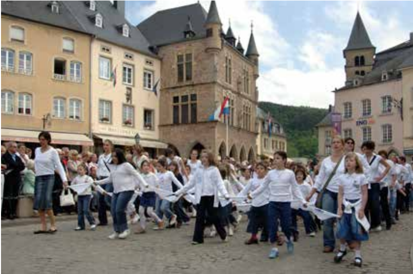
Sprangpressessioun in Echternach