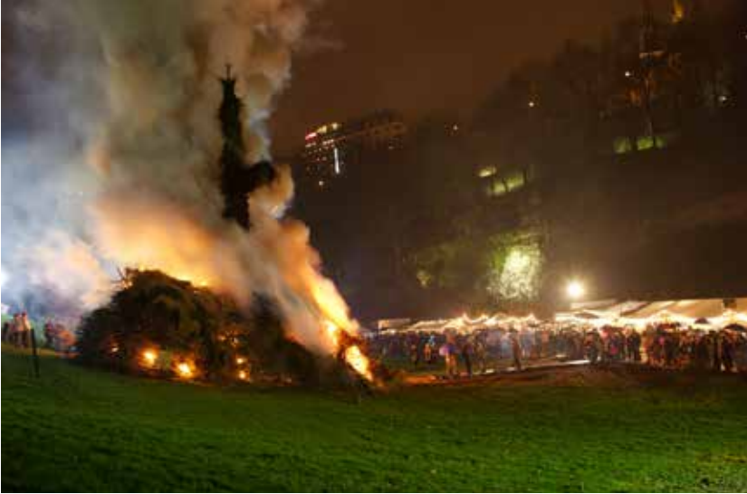
Buergbrennen in der Hauptstadt