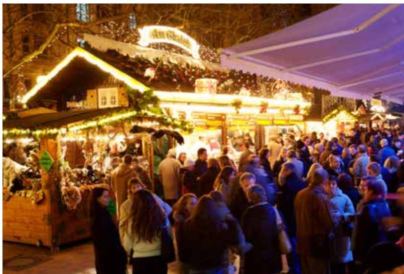
Chrëschtmaart mit Holzchalets

Übrigens, der luxemburgische Kleeschen darf auf keinen Fall mit dem deutschen Weihnachtsmann oder dem französischen père Noël verwechselt werden – das sind durchaus verschiedene Herrschaften. Gut zu wissen ist ferner, dass Luxemburg als das einzige Land gilt, in dem die Grundschulkinder am 6. Dezember schulfrei haben, damit sie sich nach dem Aufwachen ausgiebig dem Auspacken der Geschenke widmen können.