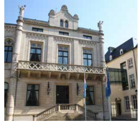
Ulusal meclis

Yasamaya ilişkin olarak ulusal meclise getirilmiş bütün yasa tasarıları ve yasa teklifleri için Ülke Konseyi'nden milletvekillerinin oylamasından önce görüş almak zorunludur. Yasalar oylama için meclise iki kere sunulur ve ikinci oylama en erken birinci oylamadan üç ay sonra yapılabilir. Eğer ulusal meclis Ülke Konseyi'nin muvafakatı ile bundan feragat ederse, bu arada olağan uygulama haline gelen ikinci oylama yapılmayabilir.