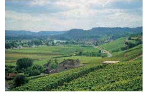
Mosel bölgesi: Nehir ve üzüm bağları