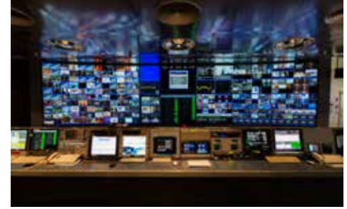
SES'in dijital şebeke operasyonları odası

Bu sektörün gelişmesini teşvik etmek için çok sayıda devlet destek programları üzerinden hükümetin proaktif politikasından görsel-işitsel üretim de yararlanmaktadır.