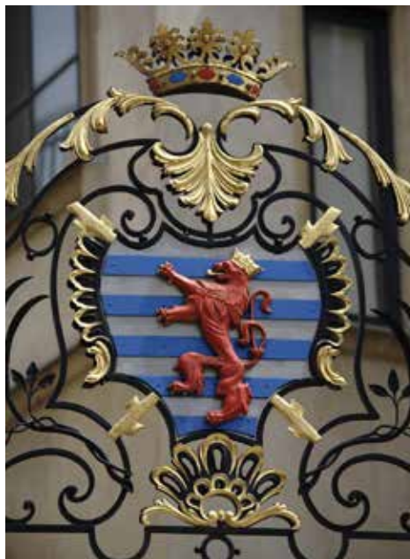
Герб на дворце Великого герцога

Герб находится под юридической защитой по закону о национальных символах от 23 июня 1972 г., измененному и дополненному законом от 27 июля 1993 г.