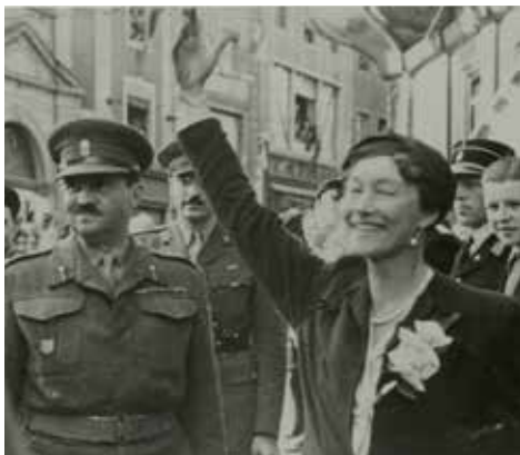
Великая герцогиня Шарлотта в 1944 г.

В сентябре 1919 г. правительство Люксембурга решило организовать референдум по двум вопросам: форме правления (монархия или республика) и экономическому курсу страны после расторжения Германского таможенного союза. Население, впервые получившее всеобщее избирательное право, подавляющим большинством проголосовало в пользу монархии и экономического союза с Францией. После отказа французской стороны люксембургское правительство заключило экономический союз с Бельгией в 1921 г., Бельгийско-Люксембургский Экономический Союз (БЛЭС). Люксембург принял бельгийский франк как валюту БЛЭСа, но в то же время оставил ограниченный выпуск люксембургских франков.