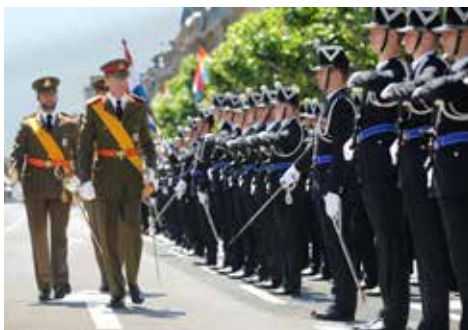
Е.К.В. Великий герцог в сопровождении своего сына, наследного Великого герцога, на праздновании Национального дня

Великий герцог является главой государства. Он – неприкосновенная персона. Это означает, что он не может быть привлечен к ответственности или преследоваться в судебном порядке. Отсутствие ответственности у Великого герцога подразумевает наличие ответственности у министров. Чтобы акт Великого герцога вступил в силу, он должен быть подписан членом правительства, таким образом принимающим на себя полную ответственность. Эта ответственность носит общий характер в отношении актов, прямо или косвенно касающихся министерских функций. Она может быть правовой, то есть уголовной или гражданской, а также политической. В принципе, любой акт, подписанный Великим герцогом, должен быть сначала представлен Совету правительства для обсуждения.