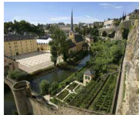
Квартал Грунд

Однако гарантии, предоставленные Лондонским договором, не помешали Германии вторгнуться в Люксембург в 1914 г. Оккупация была ограничена военной сферой. Власти Люксембурга выступили с протестом против немецкого вторжения, но продемонстрировали полный нейтралитет по отношению к воюющим сторонам. Великая герцогиня Мари-Аделаид и правительство остались у власти, что имело политические последствия в период после первой мировой войны.