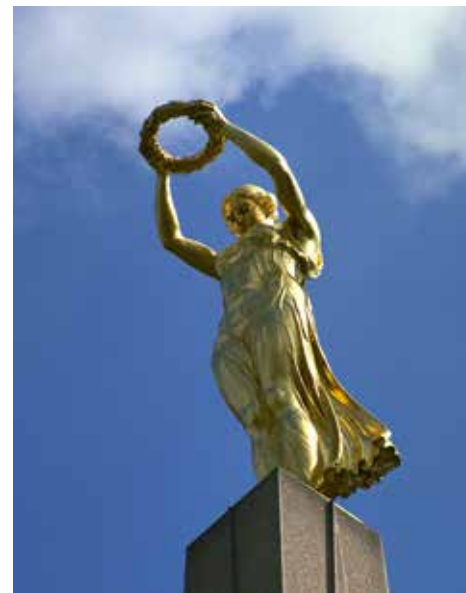
Золотая дама ( Gëlle Fra ), символ свободы и сопротивления люксембургского народа

После того, как страна была освобождена союзническими войсками в 1944 г., План Маршалла позволил начать серьезную модернизацию инфраструктуры.