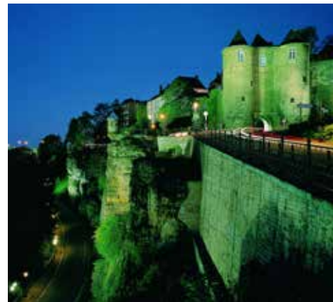
Старые укрепления столицы

Падение наполеоновской империи в 1815 г. повлияло и на статус Люксембурга. Главные европейские державы, собравшиеся на Венском конгрессе в том же году, решили укрепить королевство Нидерланды, чтобы помешать любым возможным амбициям Франции. Люксембург, имея статус великого герцогства, теоретически был автономной территорией, но при этом он был связан личной унией с королём Нидерландов и герцогом Люксембургским Вильгельмом I Оранским. В то же время членство в германском союзе повлекло за собой размещение прусского гарнизона в крепости.