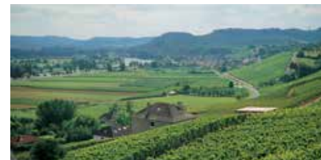
Регион Мозель: река и виноградники