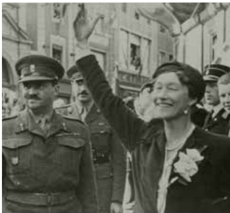
La gran duquesa Carlota en 1944

En septiembre de 1919, el Gobierno luxemburgués decidió organizar un doble referéndum para abordar tanto la forma del Estado (monarquía o república) como la orientación económica del país tras la disolución del Zollverein. En su primera votación por sufragio universal, la población