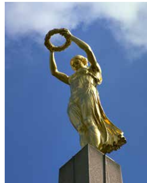
Gëlle Fra, símbolo de la libertad y de la resistencia del pueblo luxemburgués

La ocupación alemana supuso el fin de la independencia de Luxemburgo. La instauración de una administración civil alemana indicó la voluntad de los nazis de destruir las estructuras del Estado luxemburgués y de germanizar a la población. Un intenso esfuerzo propagandístico procuró fomentar la adhesión de los luxemburgueses al Reich. Desde 1942, los jóvenes luxemburgueses fueron obligados a alistarse en la Wehrmacht. La mayoría de la población dio muestras de una gran cohesión nacional. Como ocurrió en otros territorios ocupados, empezaron a formarse movimientos de resistencia, a los que el ocupante respondió con el terror y la deportación. Se calcula que las pérdidas humanas durante la Segunda Guerra Mundial fueron del 2% de la población total de Luxemburgo.