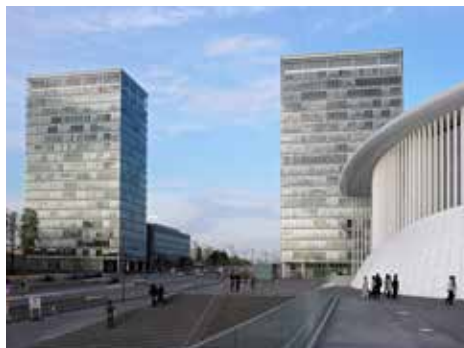
Barrio de Kirchberg

Luxemburgo está considerado como un modelo de apertura al exterior y como un microcosmos de Europa, ya que su población está formada por un 45,3% de extranjeros. Su pequeño tamaño le ha permitido conservar una imagen de país apacible y «a escala humana».