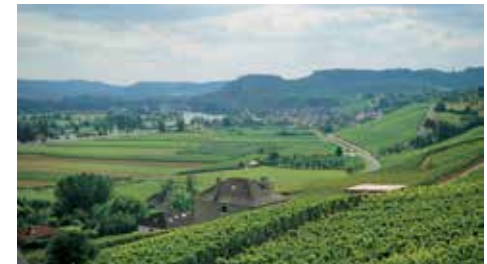
La región del Mosela: su río y sus viñedos

- El valle del Mosela es el más imponente de todo Luxemburgo, tanto por su tamaño como por la variedad de sus paisajes. Es uno de los centros turísticos más destacados del país, fundamentalmente por su actividad vitícola.