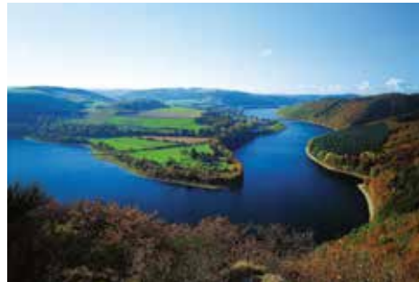
Lago del Haute-Sûre

La temperatura media anual se sitúa en 9,4 °C, variando entre -2,6 °C (valor mínimo medio) y 21,6 °C (valor máximo medio) (1981-2010).