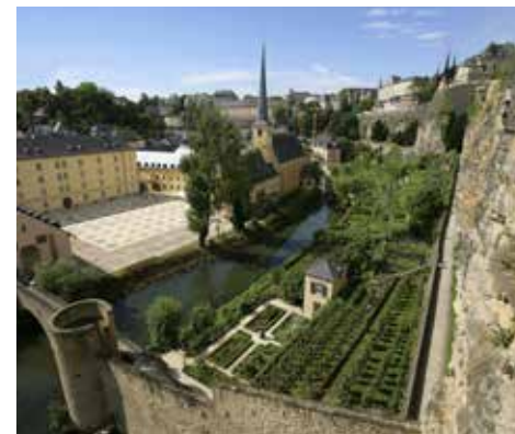
Barrio de Grund

Las garantías acordadas por el Tratado de Londres no impidieron, sin embargo, la invasión de Luxemburgo por las tropas alemanas en 1914.