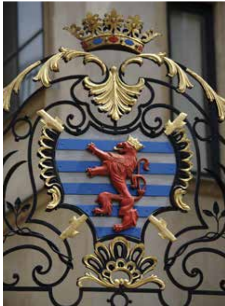
Escudo de armas en el palacio gran ducal

El escudo de armas está protegido por la Ley de 23 de junio de 1972 sobre Emblemas Nacionales, modificada y complementada por la Ley de 27 de julio de 1993.