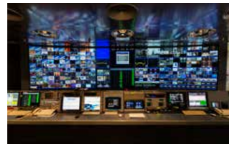
La sala de operaciones de la red digital en la SES

En este contexto, además de numerosas pequeñas y medianas empresas (Pymes), el Gran Ducado cuenta con la presencia de multinacionales de la economía digital como Amazon.com, eBay, PayPal, iTunes o Vodafone. Todo ello confirma el posicionamiento de Luxemburgo como centro neurálgico para las empresas activas en el campo del trata-