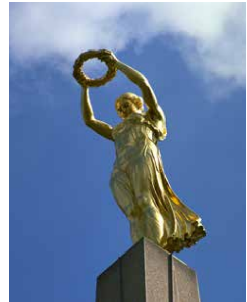
Die Gëlle Fra, Freiheits- und Widerstandssymbol des Luxemburger Volkes

Nach der Befreiung des Landes durch die alliierten Truppen im Jahr 1944 kam es im Rahmen des Marshall-Plans zu umfangreichen Anstrengungen zur Modernisierung und Schaffung von Infrastrukturen.