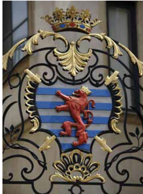
Wappen am großherzoglichen Palast

Das Wappen ist durch das Gesetz vom 23. Juni 1972 über die staatlichen Embleme geschützt, welches durch das Gesetz vom 27. Juli 1993 geändert und ergänzt wurde.