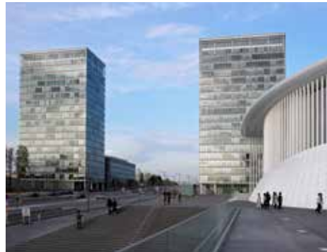
Das Stadtviertel Kirchberg

Luxemburg wird als Musterbeispiel für eine gelungene Öffnung zum Ausland angesehen und gilt mit einem Ausländeranteil von 45,3% als europäischer Mikrokosmos. Aufgrund seiner geringen Größe konnte Luxemburg das Image eines beschaulichen Landes von „menschlichen Ausmaßen“ beibehalten.