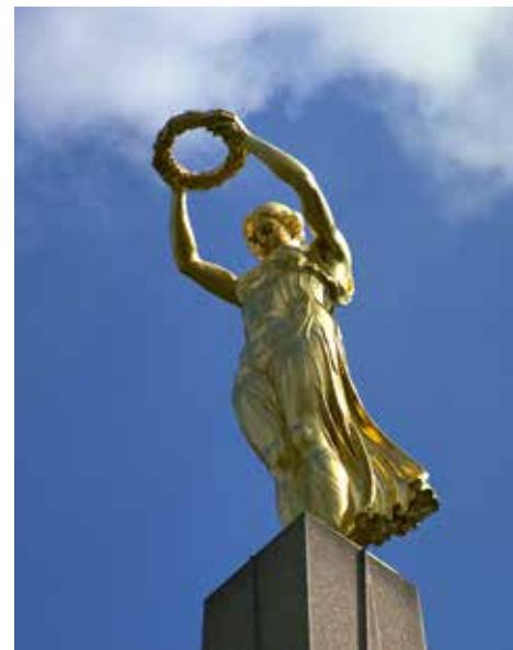
Die Gëlle Fra, Freiheits- und Widerstandssymbol des Luxemburger Volkes

Nach der Befreiung des Landes durch die alliierten Truppen im Jahr 1944 kam es im Rahmen des Marshall-Plans zu umfangreichen Anstrengungen zur Modernisierung und Schaffung von Infrastrukturen.