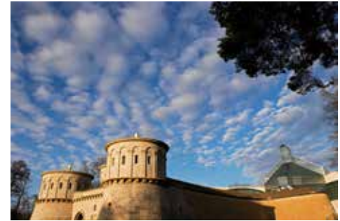
Das Musée Dräi Eechelen mit dem Musée d'art moderne Grand-Duc Jean im Hintergrund