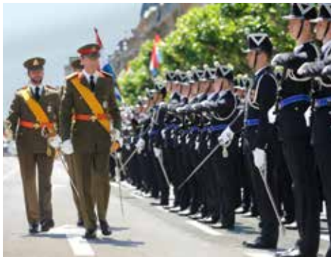
S. K.H. der Großherzog, gefolgt von seinem Sohn, dem Erbgroßherzog, am Nationalfeiertag

Der Großherzog ist das Staatsoberhaupt. Seine Person ist unantastbar, was bedeutet, dass er nicht zur Verantwortung gezogen werden kann: Er kann weder angeklagt noch gerichtlich belangt werden. Aus der Nichtverantwortlichkeit des Großherzogs ergibt sich die Verantwortlichkeit der Minister. Damit eine Handlung des Großherzogs wirksam werden kann, muss sie von einem Mitglied der Regierung gegengezeichnet werden, das dadurch die volle Verantwortung dafür übernimmt. Im Zusammenhang mit Handlungen, die direkt oder indirekt mit dem Ministeramt zusammenhängen, handelt es sich hierbei um eine allgemeine Verantwortung. Diese kann sowohl die juristische, d.h. straf- oder zivilrechtliche Verantwortung als auch die politische Verantwortung umfassen. Grundsätzlich muss jede Handlung, für die der Großherzog eine Unterschrift geleistet hat, dem Regierungsrat vorher zur Beratung vorgelegt worden sein.