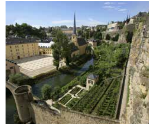
Das Stadtviertel Grund

Trotz der im Londoner Vertrag gewährten Garantien kam es 1914 zur Invasion Luxemburgs durch die deutschen Truppen. Die Besetzung beschränkte