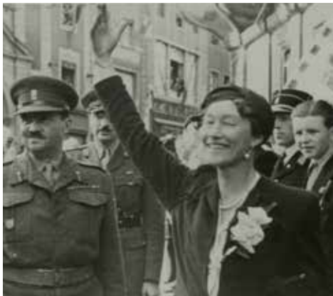
Großherzogin Charlotte 1944

Im September 1919 beschloss die Luxemburger Regierung, ein Doppelreferendum abzuhalten, bei dem es sowohl um die Staatsform (Monarchie oder Republik) als auch um die wirtschaftliche Ausrichtung des Landes nach dem Austritt aus dem Zollverein ging. Die Bevölkerung, die erstmals mit allgemeinem Wahlrecht abstimmte, sprach sich mit